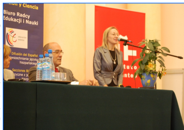
La Jefa de la Sección de Lenguas Modernas durante la presentación del acto de entrega

En 2005, la Agencia nacional Sócrates polaca otorgó a este programa el distintivo European Language Label 2005 por su calidad y por ser una iniciativa innovadora cuyo diseño se inspira en las directrices recomendadas por las instituciones lingüísticas europeas.