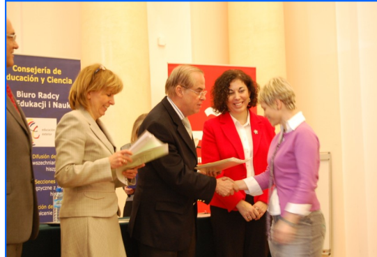
Directora del CODN, Embajador y Consejera durante la entrega de diplomas