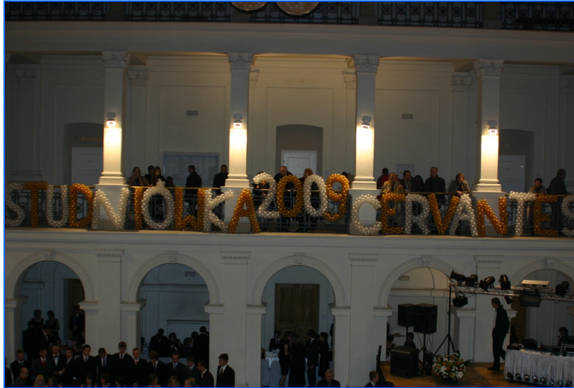
Imagen de la sala donde se celebró la Studniówka

Como si hubiera llegado a las bambalinas donde las actrices ensayan una obra teatral de época imperial, o en los camerinos de las modelos que se preparan para la pasarela Cibeles o en una habitación donde las damas de honor se dan los últimos retoques para la boda del año, allí se alborotaban decenas de jóvenes ajetreadas en cambiarse del frío, la nieve, la noche y