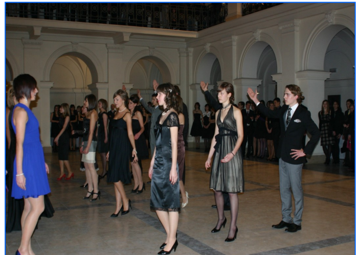
Imágenes de los alumnos del Liceo Cervantes de Varsovia durante el baile