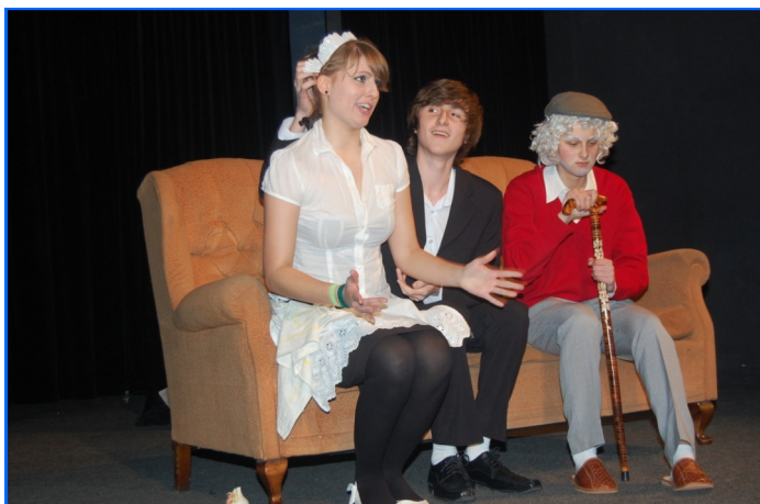
Actores y actrices de los centros ganadores del concurso de teatro interpretando "El diván" (arriba) "Yerma"

La obras ganadoras fueron "El diván" de Carlos Etxeba , interpretada por los alumnos del Liceo XXII José Martí de Varsovia y "Yerma" , de F. García Lorca, interpretada conjuntamente por los alumnos del Liceum XVII y Gimnazjum 26 de Poznań. Estos dos centros escolares representarán a Polonia en el Festival Internacional de Teatro Escolar que se celebrará este año en Bucarest, Rumanía, en el próximo mes de abril.