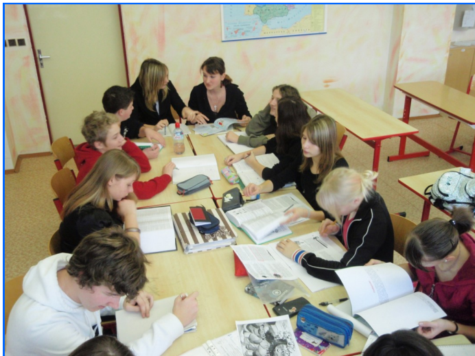
Alumnos de la sección bilingüe del Klasické a španělské gymnázium de Brno

En junio del año pasado recibimos en el Klasické a španělské gymnázium de Brno una propuesta del Centro Aragonés de Recursos para la Educación Intercultural, que nos invitó a participar en su proyecto dentro del "Año Europeo del Diálogo Intercultural 2008". Entre otras actividades, consistía en traducir el cuento "El País de los Colores" al checo y sumarse al Manifiesto por una escuela antirracista . La idea fundamental del C.A.R.E.I. era ir colgando versiones del cuento en distintos idiomas en su página web.