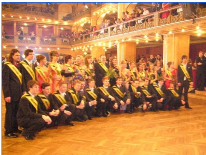
Imagen del grupo de la clase bilingüe de español

Después de imponer a cada uno de ellos la tradicional banda, se iniciaron los bailes de salón, con la activa participación de todos. Asimismo hubo ocasión de disfrutar con diversas actuaciones lúdicas donde los alumnos mostraron ingenio y creatividad.