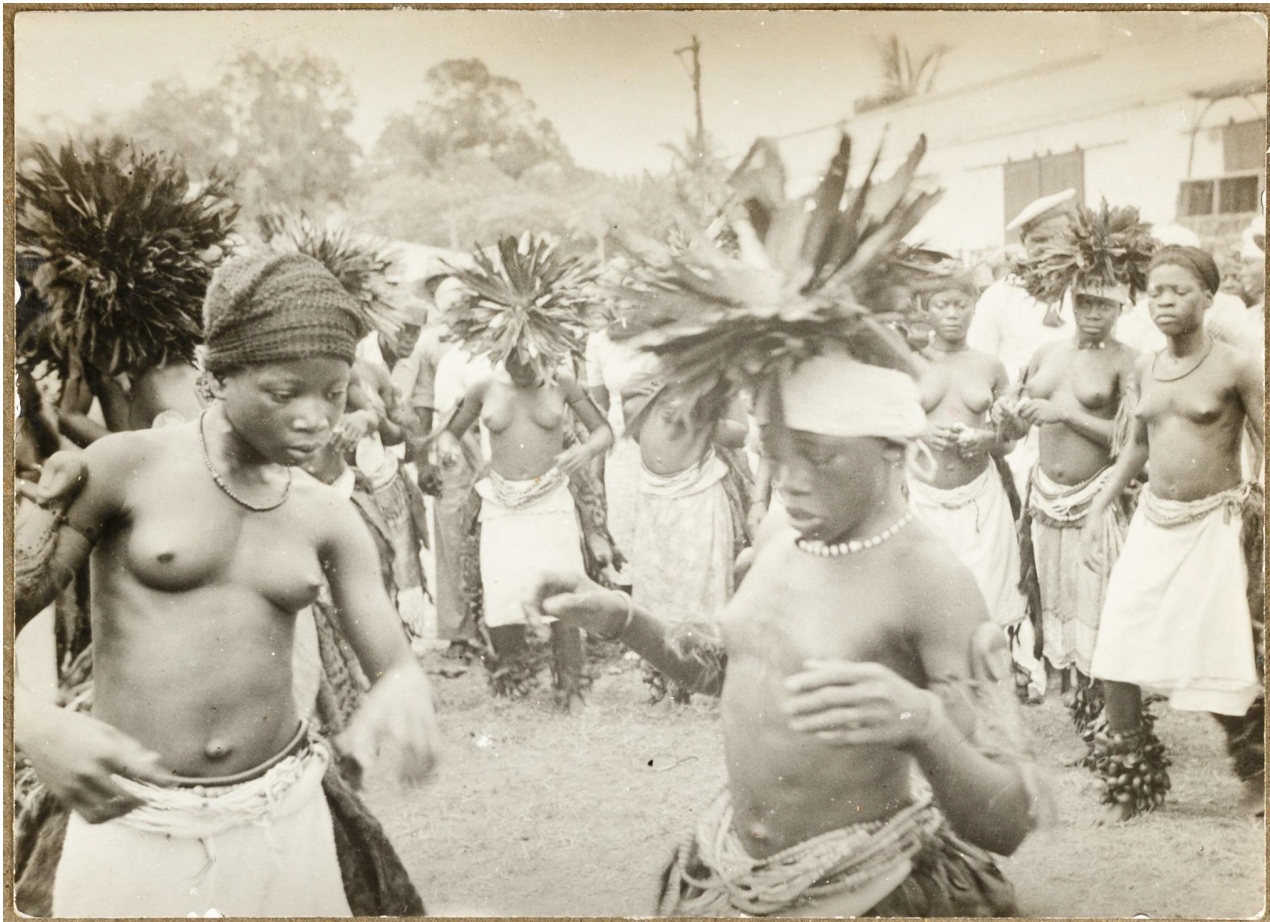
Figura 12. El balele , como este retratado en una imagen de mediados del siglo XX, es un baile comunitario con origen ritual. Con el tiempo se convirtió en parte de espectáculos ofrecidos a los colonos y, posteriormente, a turistas. N.º de inventario MNA: FD5247.

En 1933 Francisco Madrid anunciaba que el «espíritu prostituido de Occidente ha llegado a las tierras casi vírgenes de la Guinea [...]». En cierto modo, considera que la institución de la hospitalidad fang, el mvía , ha sido pervertida por los españoles aprovechando que, en tiempos de la colonia, todavía se vivía el «periodo del amor huésped, del amor hospitalario...»: «Antes, todo esto tenía un tono de hospitalidad sabrosa. Cena y lecho, amistad y amor pasajero para el que cruzaba los poblados y las selvas. Pero ahora los blancos han soliviantado el instinto de compra y venta del amor. Se paga y se cobra» (Madrid, 1933: 97-98).