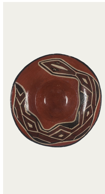
Figura 10. Cuenco mukawa de Melva Shiwango (2008). Donación de Cauri, Asociación de Amigos del Museo Nacional de Antropología. N.º de inventario MNA: CE20207.