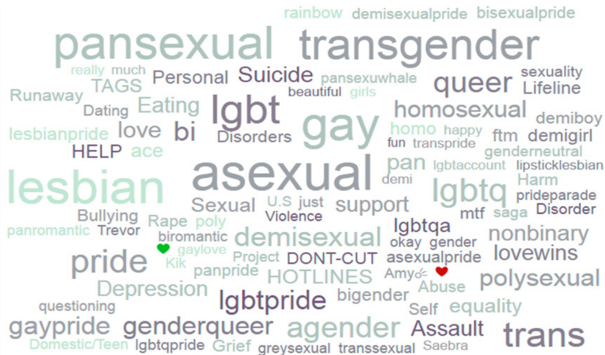
Figura 1. Fuente Instagram (realizado por Maite García Català).

La investigación se llevó a cabo entre usuarixs de Instagram combinando métodos cuantitativos (extracción de datos con un data extractor diseñado para la investigación) y cualitativos (análisis y entrevistas). El cuadro de la figura 1 muestra algunas de las categorías que encontramos y cómo se relacionan entre sí. Como es habitual en estos modelos de visualización en nube, el tamaño de la letra indica la frecuencia con la que los términos son asociados. En este caso, el hashtag «asexual» se relaciona intensamente con los hashtags pansexual, transgender , lesbian y gay . Encontramos también otras categorías como bigender , polysexual , nonbinary , queer , greysexual , bisexual, panromantic , etc. Estas categorías se siguen produciendo en relación con un cuerpo que sigue remitiendo a una lógica cultural que relaciona cuerpo-género-sexualidad. Cambian las direcciones, pero no las lógicas.