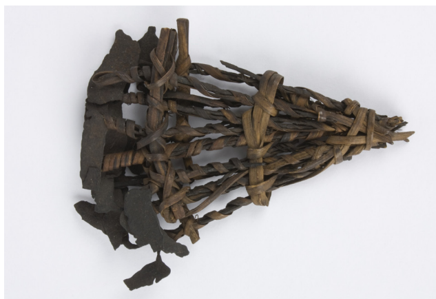
Figura 11. Bikuele . Es la moneda empleada por los fang solo para las transacciones matrimoniales. El comercio se regulaba mediante el trueque. Solo la imposición del sistema económico colonial supuso la aparición del «dinero para todo uso». N.º de inventario MNA: CE20097.

Juan Aranzadi define el pago de la dote como la transferencia de bienes del grupo de parentesco del novio al grupo de la novia. El bikuele es la moneda para el pago de la dote (Aranzadi, 2009: 68, 111). Los bikuele son puntas de lanza metálicas que se agrupan en paquetes de diferentes cantidades. El hermano se podía casar gracias a la dote que se había obtenido con