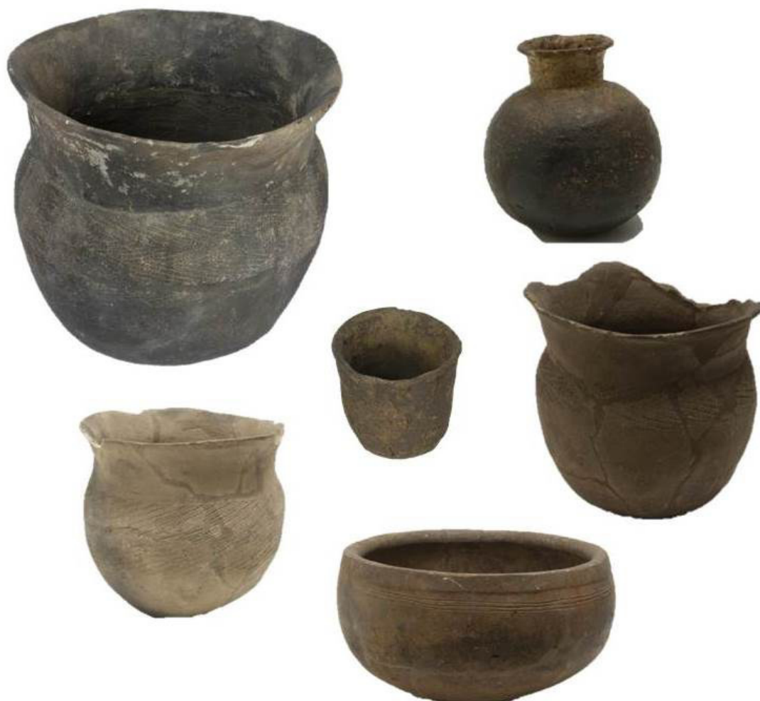
Figura 7. Principales tipologías cerámicas de los fang. La producción cerámica, como parte de la actividad doméstica, era una tarea exclusivamente femenina. N.º de inventario MNA: arriba izquierda CE11712, arriba derecha CE11702, centro izquierda CE11708, centro central CE11719, centro derecha CE11716, abajo CE11704.

Los fang practican una agricultura de tala y quema que determina sus movimientos poblacionales. De esta manera, cuando un determinado territorio se ha agotado, migran en busca de un nuevo asentamiento que permita la explotación de las tierras cercanas. La estructura social fang es compleja. La antropología ha pretendido traducir de forma directa los diferentes términos de parentesco fang asociándolos a conceptos occidentales. Como se ha podido comprobar en estudios posteriores y revisiones críticas, estas equivalencias invisibilizaban la complejidad del sistema de parentesco fang. Simplificando en exceso, la unidad básica es el clan, del que se consideran todos sus miembros parientes entre sí. El clan ocupa una determinada región y supone que no es necesaria la vecindad geográfica para mantener los lazos familiares. La familia básica se correspondería con el poblado. Se cree en la existencia de un fundador mítico que, acompañado de sus esposas, habría creado un poblado donde vivir con ellas y con su descendencia.