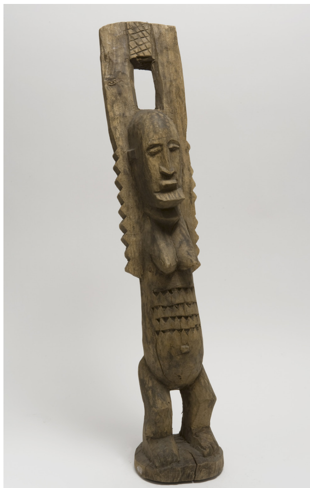
Figura 3. Figura Nommo, representa a los ancestros de los dogón (Malí). En ella se mezclan rasgos femeninos y masculinos. N.º de inventario MNA: CE18612.

Algo parecido ocurre respecto a las máscaras mbuya de los pendé, en el este de la actual República Democrática del Congo. A principios