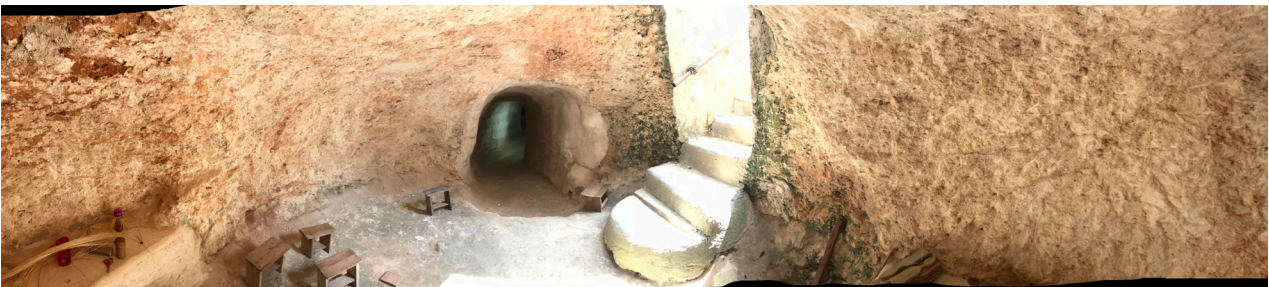
Figura 5. Fotografía de Andrea Mosqueda Escalante, 2018.