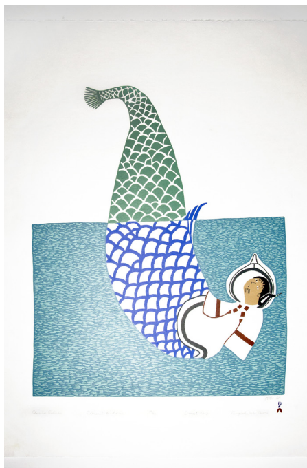
Figura 9. Elusive Sedna de Ningiukulu Teevee (2013). Donación de Cauri, Asociación de Amigos del Museo Nacional de Antropología. N.º de inventario MNA: CE20538.