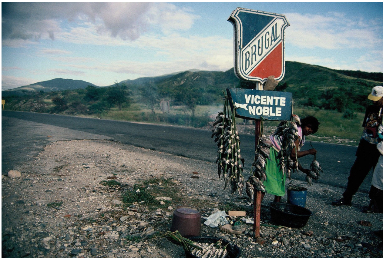
Figura 1. Cruce de Vicente Noble.

La fotografía (figura 1), en el momento que la realicé, tenía como propósito mostrar el conocido por los lugareños como «cruce de Vicente Noble», punto en la carretera de Santo Domingo a Barahona en el que se indica el desvío a Vicente Noble y lugar desde el que emigró en la década de los 90 un importante número de mujeres. Pero también me proponía mostrar una de las actividades económicas que realizan las mujeres más empobrecidas de la zona, para tratar las desigualdades de género y raza que me ayudarían a comprender esta emigración que en última instancia era el objetivo de mi trabajo de investigación etnográfica. La mujer y el hombre que me acompañaban ese día pasan en este momento a un lugar muy secundario, apenas aparecen al margen derecho de la fotografía, lo que es una pena porque, aun sin haber estado allí, seguro que nos permitirían apreciar la diferencia que supone el estatus adquirido entre las que emigran y las que se quedan 10 .