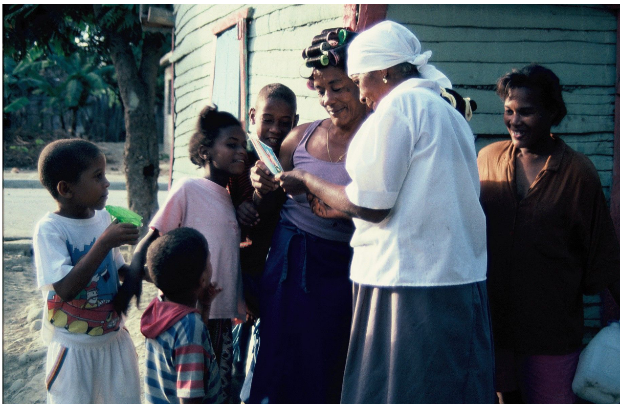
Figura 3. Santica mostrando a vecinos y familiares fotografías de España.