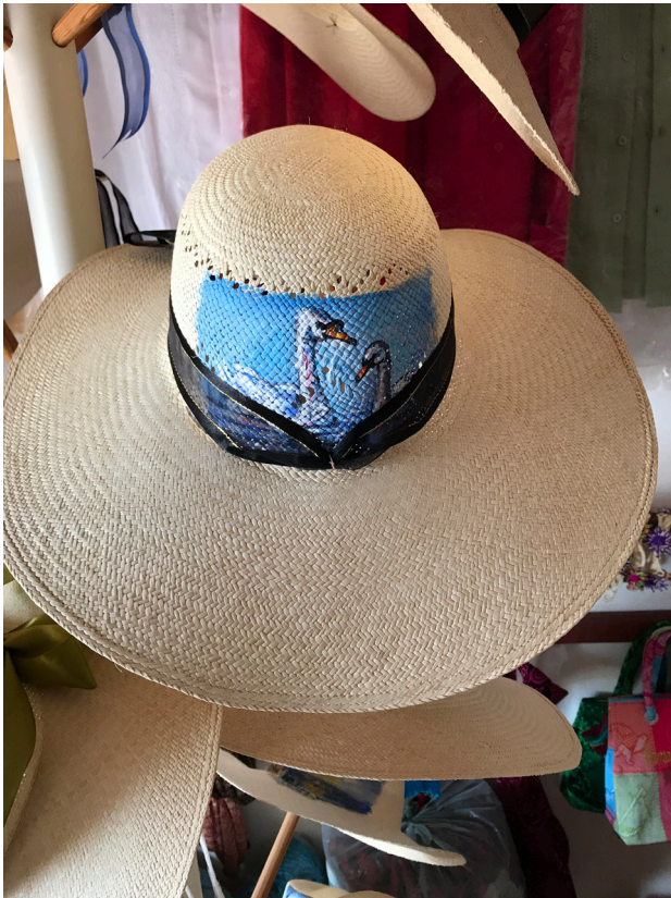
Figura 1. Fotografía de Andrea Mosqueda Escalante, 2018.