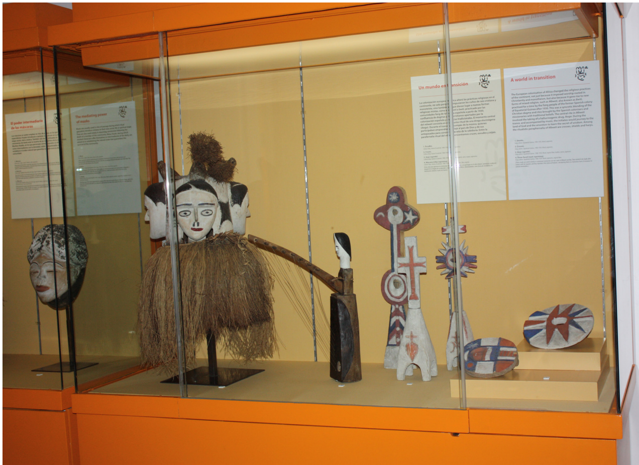
Figura 11. Vitrina Un mundo en transición .

En la cartela de la vitrina sobre la religión yoruba, La religión de los orishas , hemos incluido más información e introducimos la esclavitud: «Los yoruba viven en Nigeria, Benín y Togo. Su religión llegó a América a través del inhumano comercio de esclavos organizado por los europeos. Los esclavos africanos siguieron practicando su religión aunque ahora con influencias de las de los pueblos originarios de América y el catolicismo, dando lugar al candomblé en Brasil o la santería en Cuba, Puerto Rico y Venezuela». Además conectamos así esta vitrina de la sala de África con dos vitrinas de la sala de América dedicadas a las religiones de las comunidades afrodescendientes en América: La sociedad secreta masculina Abakuá: tambores sagrados y Vudú, la religión de los loas .