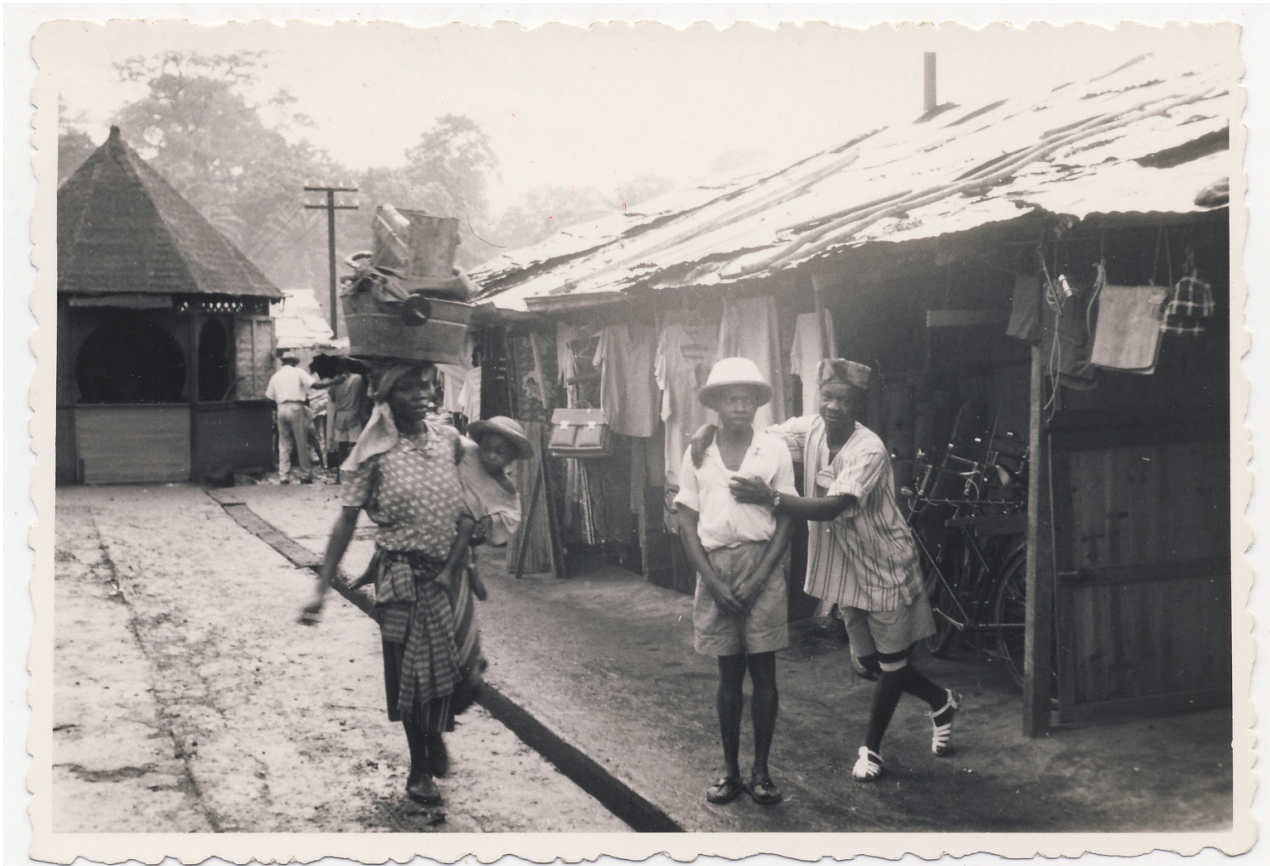
Figura 6. Las primeras descripciones en torno a Guinea tomaban a partes iguales las referencias etnográficas y las citas literarias, por lo que generaban una peculiar imagen de la colonia en la metrópolis. N.º de inventario MNA: FD5591.