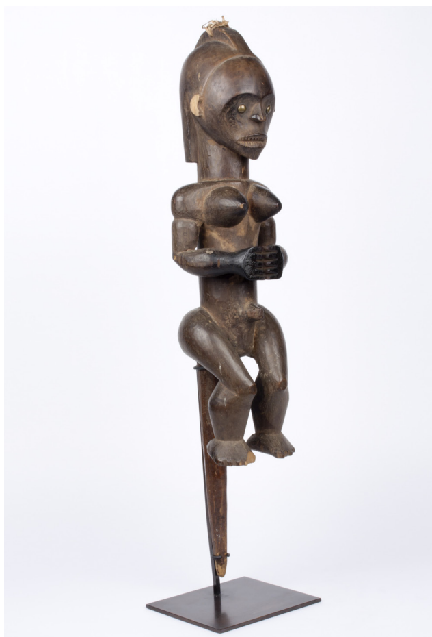
Figura 1. Talla femenina byeri , o guardián del relicario, fechada en el tránsito del siglo XIX al XX, y relacionada con el culto a los antepasados de los fang. N.º de inventario Museo Nacional de Antropología (MNA): CE11789.

Una de las primeras monografías sobre los fang, con un pretendido carácter científico y/o etnográfico, es la de Gunter Tëssmann. Escrita en 1912 y publicada en 1913, es el resultado del trabajo de campo del alemán entre los entonces «pamúes» durante los años 1907 a 1909. En esta extensa obra ofrece una descripción detallada de la cultura fang en todos sus aspectos. Incluso, se plantea la necesidad de ofrecer una visión cierta y contrastada mediante un método etnográfico válido que arroje luz sobre los fang. En sus páginas encontramos referencias constantes al papel de la mujer en determinados aspectos de la vida fang, incluyendo capítulos dedicados a la sexualidad o al parentesco. Sin embargo,