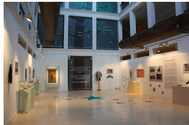
Figura 5. Exposición temporal «Personas que migran, objetos que migran... desde Senegal».