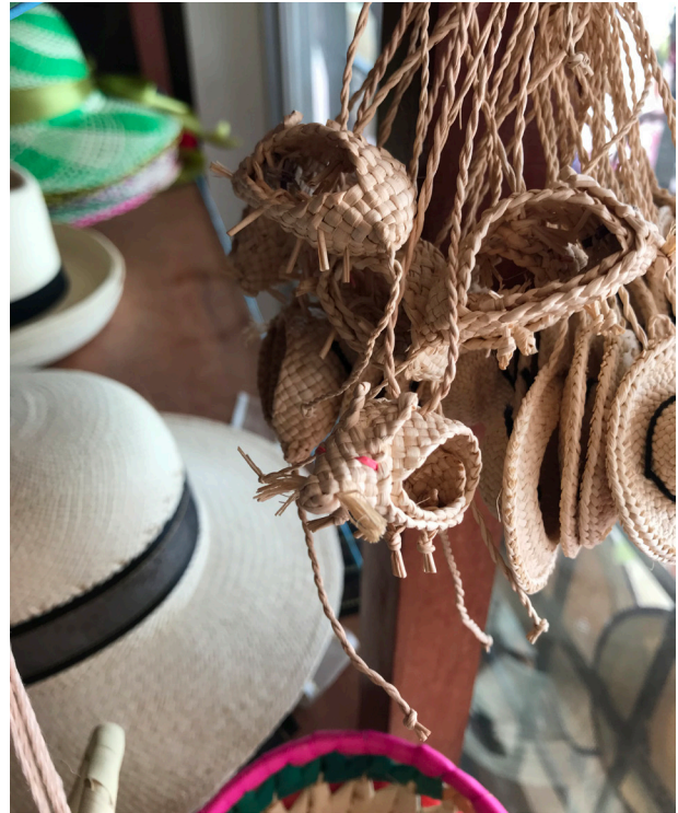
Figura 13. Fotografía de Andrea Mosqueda Escalante, 2018.

La protección de la cultura material no solo es importante para las comunidades que se benefician de ella, también debería serlo para los Estados en la defensa de los derechos de sus habitantes, de sus recursos naturales, de su desarrollo económico y cultural, y en un sentido más político, para posicionar la identidad regional o nacional a través de la producción de sus ciudadanos.