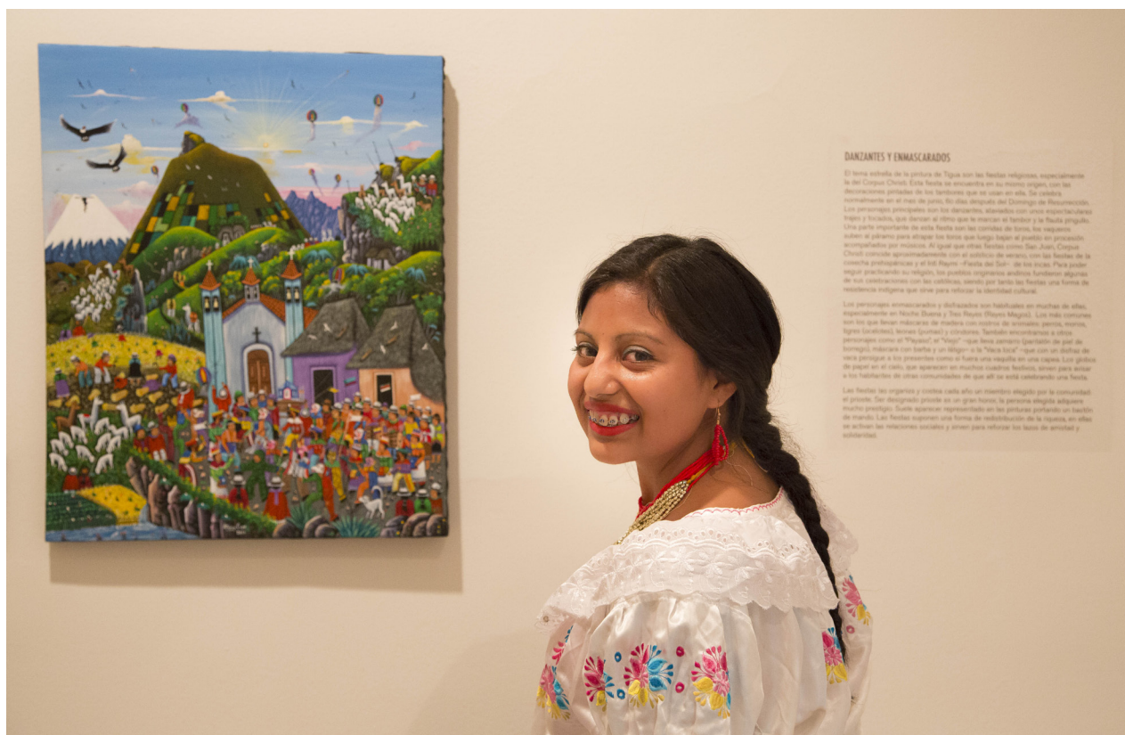
Figura 3. Exposición temporal «Tigua: Arte desde el centro del mundo».

migran... desde Senegal» (noviembre 2018 - marzo 2019) 12 . El museo ofrece los medios y asesoramiento, pero son los migrantes que participan en el proyecto los que toman las decisiones que afectan a la exposición y elaboran el discurso. Son ellos los que deciden qué es lo que quieren contar sobre sí mismos, sobre su país de origen y sus experiencias en España. La próxima edición se dedicará a la comunidad china en Madrid y se inaugurará en 2021. Nos gustaría incorporar parte de estas exposiciones y su metodología de trabajo a la nueva permanente, como en muchos otros museos, en el MNA las exposiciones temporales sirven para ensayar nuevos discursos que se pueden incorporar a la exposición permanente.