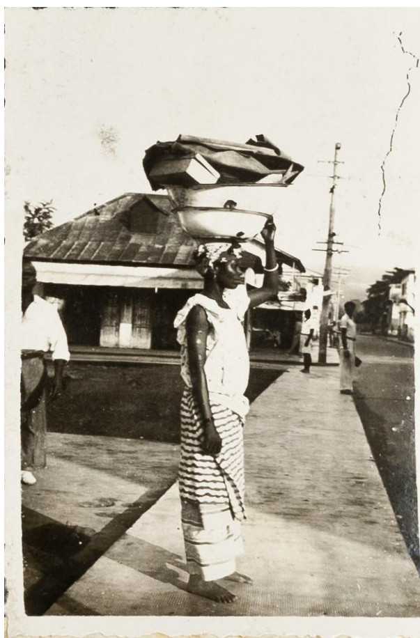
Figura 13. Según la imagen, retrato de perfil de una mujer en el «barrio yaoundé», de Santa Isabel, actual Malabo, capital de Guinea Ecuatorial. La imagen se supone tomada en época colonial y nada parece haber cambiado. N.º de inventario MNA: FD5430.