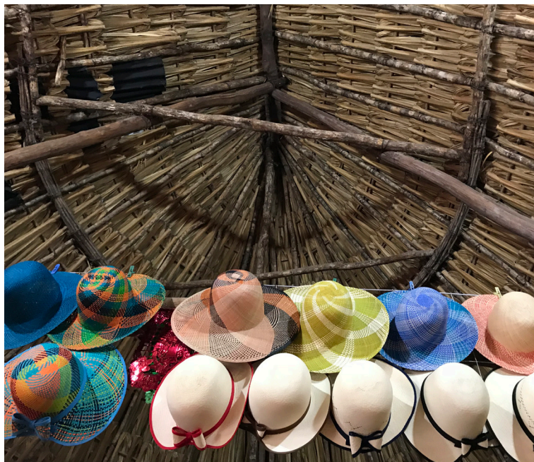
Figura 10. Fotografía de Andrea Mosqueda Escalante, 2018.