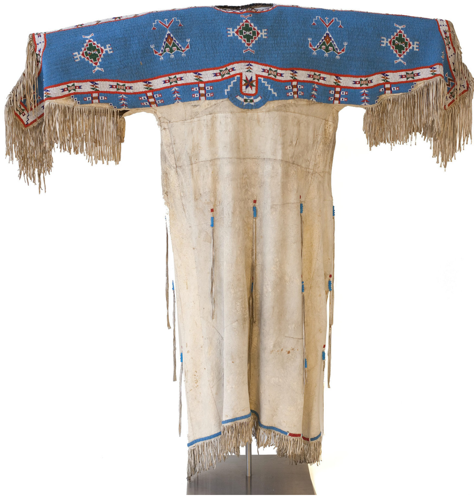
Figura 13. Vestido lakota (1900-1923). N.º de inventario MNA: CE19171.

En muchos de estos ejemplos destacamos la capacidad de resistencia frente a los colonizadores, ya sea a través del humor, como en la máscara ngontang ; del arte, como en el vestido lakota; o de la religión, como en las fiestas andinas. Nos parece importante evitar las representaciones coloniales en las que los pueblos originarios aparecen como sujetos pasivos 27 . Pero son pocos ejemplos y nos gustaría tratar de una manera más extensa el colonialismo en la futura exposición.