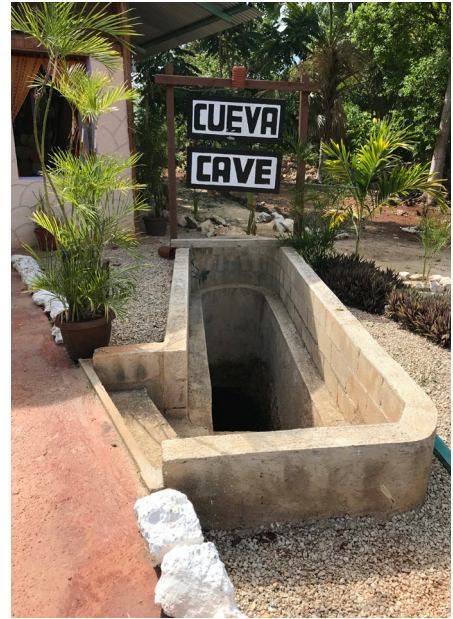
Figura 4. Fotografía de Andrea Mosqueda Escalante, 2018.