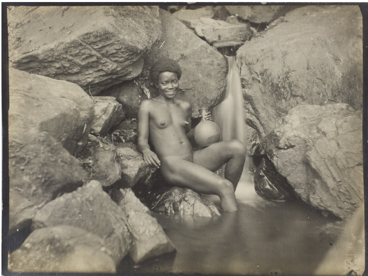
Figura 2. En las imágenes fotográficas como esta, que podría fecharse en el primer tercio del siglo XX, se recreaba una imagen de la mujer africana hipersexualizada, de acuerdo a los intereses y deseos de los europeos. Archivo documental del MNA, n.º de inventario: FD4457.

Henry Lewis Morgan acuñó en 1877 el término de «promiscuidad primitiva» (Martín Casares, 2017: 81), se refería expresamente al continente negro. Los europeos asumieron que los negros solo eran capaces de entender el sexo como algo primigenio y primitivo, sometido a los instintos más básicos y animales. Para los antropólogos decimonónicos que trabajaron en África, el sexo entre los negros se reducía a una cuestión meramente reproductiva, sin dejar ningún tipo de atisbo a relaciones de tipo recreativo.