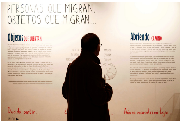
Figura 4. Exposición temporal «Personas que migran, objetos que migran... desde Ecuador».