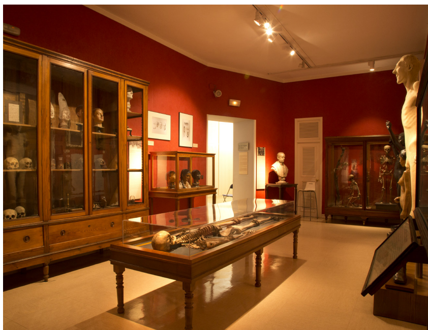
Figura 2. Sala dedicada a los orígenes del MNA.

El resto de las salas se dedican a mostrar la diversidad cultural en América, África y Asia. Las plantas de América y África cuentan con un esquema muy similar, con áreas temáticas dedicadas al modo de vida, la vida doméstica, la indumentaria, el ocio y la religión 2 . La planta de Asia se divide en dos salas, una centrada en Filipinas, que sigue el mismo esquema de las plantas de América y África, y otra dedicada a las religiones orientales, donde se exponen obras representativas del budismo, el hinduismo y el islam.