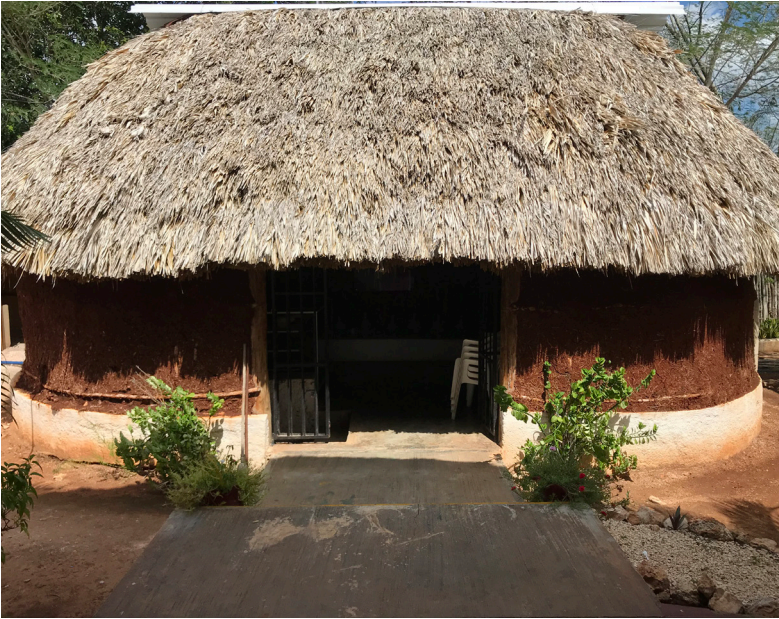
Figura 3. Fotografía de Andrea Mosqueda Escalante, 2018.