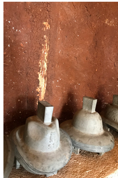
Figura 8. Fotografía de Andrea Mosqueda Escalante, 2018.