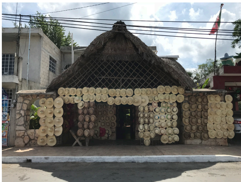
Figura 12. Fotografía de Andrea Mosqueda Escalante, 2018.