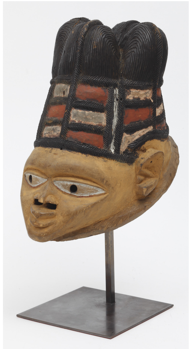
Figura 5. Máscara gelede , yoruba (Nigeria). Representa una figura femenina, pero es utilizada por los hombres en ceremonias de fertilidad de los campos. N.º de inventario MNA: CE982.