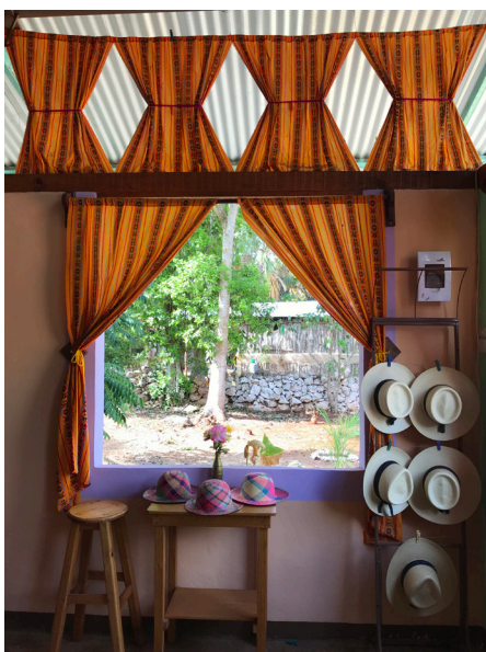
Figura 11. Fotografía de Andrea Mosqueda Escalante, 2018.