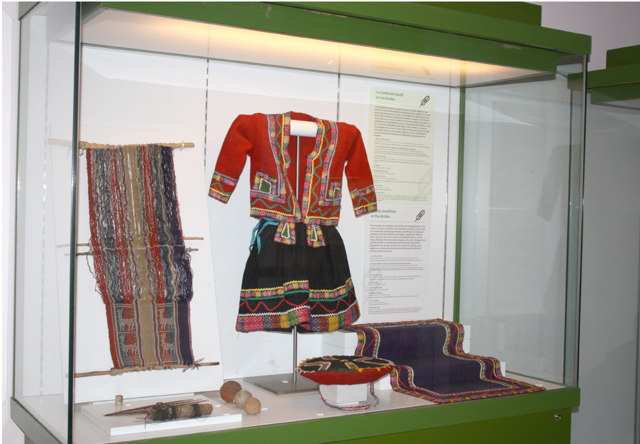
Figura 17. Vitrina La tradición textil en los Andes .

También hemos comenzado a incluir voces distintas a las de los profesionales del museo. Yousoupha Sock, uno de los comisarios de la exposición de Senegal, es el autor de la cartela de una vitrina dedicada a los instrumentos musicales senegaleses, Instrumentos que nos hablan sobre la historia . El texto, que está redactado en primera persona y firmado por él, habla de la importancia que tiene el xalam para los wolof y el riiti en las culturas paulh y serer.