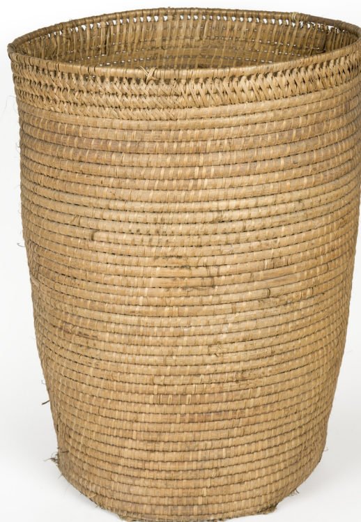
Figura 10. Cesta nkue fang. Este tipo de cesta, utilizada por las mujeres fang, se convirtió en símbolo para los colonos españoles de la opresión femenina que se vivía en la Guinea precolonial. N.º de inventario MNA CE11423.