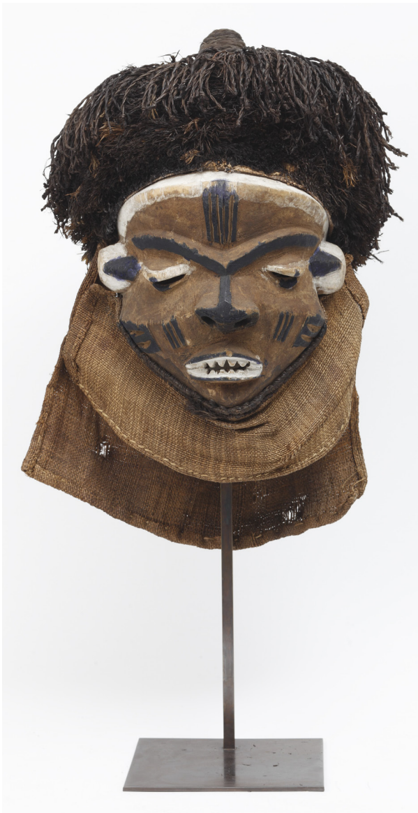
Figura 4. Máscara mbuya , diseño que representa la figura del líder entre los pende (República Democrática del Congo). El líder debe reunir en una misma persona las virtudes masculinas y femeninas en beneficio de la comunidad. N.º de inventario MNA: CE11780.

del siglo xx los pende diseñan una amplia tipología de máscaras que representan a distintos personajes estereotipados de la sociedad. Una de ellas nos llama la atención, ya que en sus rasgos faciales los pende resumen los atributos que consideran masculinos y femeninos. Esta peculiar máscara debía representar al líder de la comunidad. En su persona debían reunirse las virtudes femeninas y las masculinas, como ideal del líder que tenía a su cargo los destinos de la comunidad. Por último, la máscara gelede de los yoruba representa a una figura femenina. Se utiliza en rituales propiciatorios de la fertilidad de los campos y se pone en relación con un culto a la madre primigenia Inyala. Los danzantes siempre eran hombres, en una clara muestra de travestismo ritual. Los yoruba compartían esa peculiar visión, tan común en el continente, de la mujer como elemento intermedio entre lo humano y lo divino, entre la cultura y la naturaleza, en conexión estrecha con la tierra, como ser capaz de dar la vida (Gutiérrez Usillos, 2017: 354-355; Rachewiltz, 2017: 97).