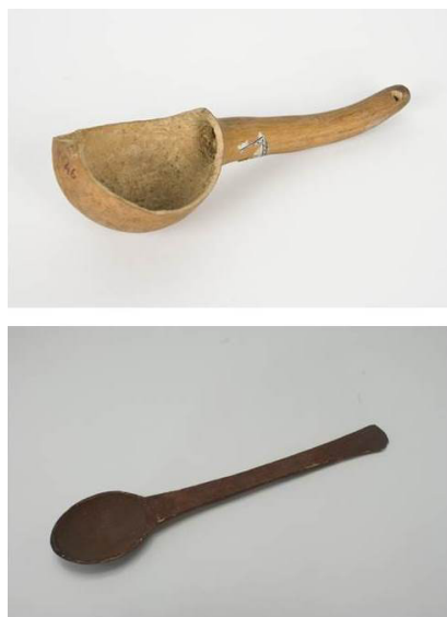
Figura 8. Cucharas femeninas. Frente a la complicación y variedad tipológica de las cucharas masculinas fang, las femeninas son formas simples, que solo se utilizaban para cocinar, no para comer. N.º de inventario MNA: arriba CE11285, abajo CE4333. Fotografías de Arantxa Boyero Lirón (arriba) y Miguel Ángel Otero (abajo).

Otro marcador material que nos informa de las relaciones de género establecidas entre los fang es la cuchara. Había dos tipos básicos, unas femeninas y las otras masculinas. Las primeras, las de la mujer, eran piezas simples, sin apenas decoración, de largo mango y pala lisa. Se utilizaban exclusivamente para preparar los alimentos. De hecho, las mujeres utilizaban otras cucharas y otros instrumentos para comer, en ocasiones simples conchas u hojas, trozos de calabaza sin apenas modificación. Sin embargo, las cucharas masculinas tienen una enorme complejidad tipológica y decorativa. Es una industria muy rica que realizan los hombres en la casa de la palabra. Es uno de sus objetos más preciados. Tessmann ha llegado a distinguir cuatro tipos principales de cucharas masculinas, con una enorme variedad decorativa. En este caso, estas cucharas, más pequeñas, se utilizaban exclusivamente para comer. La comida establecía una diferenciación sexual: las más elaboradas eran las masculinas, frente a las más simples que eran las comidas propias de las mujeres. Ramón Perpiñá (1945: 82) afirmaba que «[El hombre fang] desdeña hasta tal punto el saber condimentar, que al faltarle la mujer, vive de frutos directamente comestibles que eventualmente recoge por el bosque, o de hospitalidad».