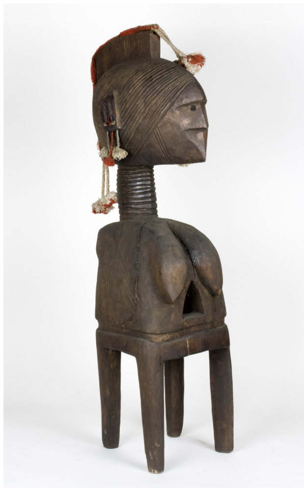
Figura 15. Máscara nimba de la cultura nalú (siglo xx), se incorpora a la vitrina Máscaras y tocados que comunican dos mundos . N.º de inventario MNA: CE11907.

perspectiva de género, se explica mejor la importancia de las sociedades secretas 28 . En la vitrina Máscaras y tocados que comunican dos mundos , centrada en las ceremonias de las culturas nalú y bijago de Guinea Bissau, se ha incluido una máscara nimba , que representa a una divinidad de fecundidad universal y se utiliza en el rito de iniciación femenino, ya que el resto de las piezas de esa vitrina se relacionaban con la iniciación masculina. Por último, en la vitrina dedicada a la iniciación de los jóvenes pende, de la República Democrática del Congo, mediante la cual pasan a formar parte de la sociedad secreta masculina Mukanda, se ha cambiado la máscara mbuya , para mostrar una del tipo fumu , o «máscara del jefe», concretamente la que aparece en la portada de esta edición de Anales del Museo Nacional de Antropología , que «combina rasgos masculinos y femeninos, ya que un líder debe tener cualidades de ambos géneros para gobernar bien».