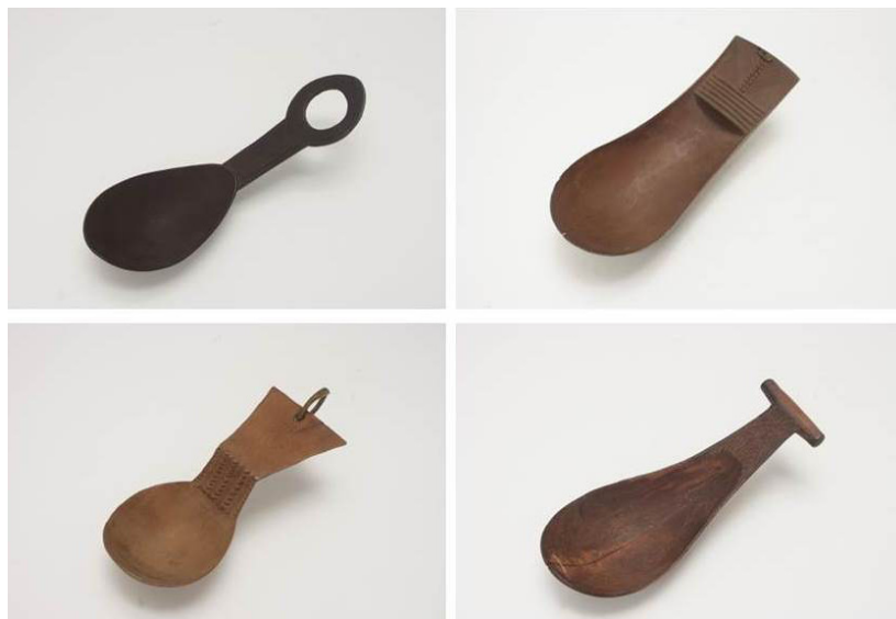
Figura 9. Cucharas masculinas fang de la colección del Museo Nacional de Antropología. La cuchara para comer era un atributo reservado para los hombres del grupo. La variedad tipológica de las cucharas masculinas es amplísima, frente a las formas simples de las femeninas. N.º de inventario MNA: arriba izquierda CE1122, arriba derecha CE4193, abajo izquierda CE4222, abajo derecha CE11320.