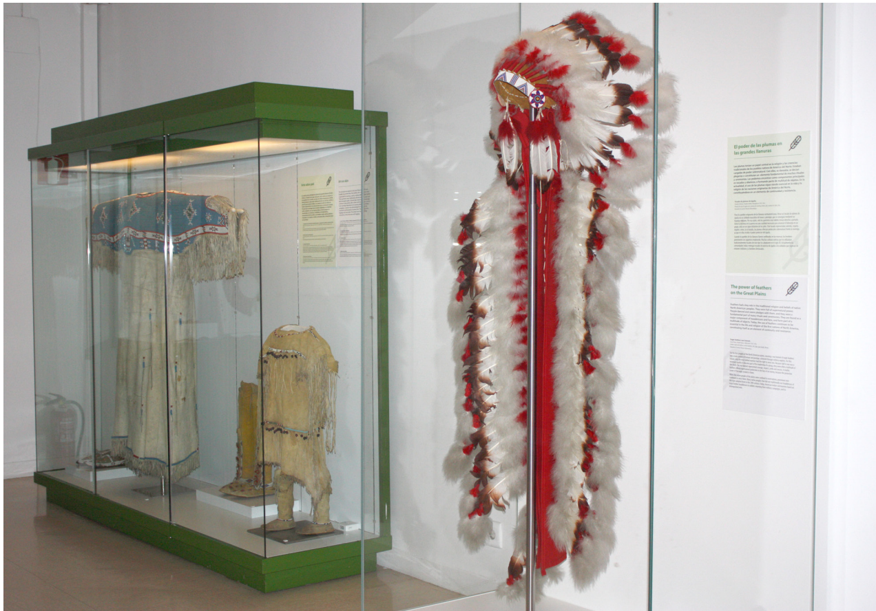
Figura 16. Vitrinas El poder de las plumas y Arte sobre piel .

En la sala de América se tratan las relaciones de género en varias de las vitrinas, como en Caza y pesca en la Amazonía , donde se habla de la división sexual del trabajo, o en Espacio femenino y espacio masculino , dedicada a la vivienda shuar y la división del espacio doméstico en función del género en esta cultura de la Amazonía ecuatoriana. En El poder de las plumas se trata el prestigio masculino en las sociedades tradicionales del área de las grandes llanuras. Junto a ella hay una vitrina dedicada a la indumentaria en esta área, Arte sobre piel , realizada por las mujeres, y se destaca que «al igual que el prestigio de los hombres dependía de su habilidad como cazadores y de sus hazañas bélicas, el de las mujeres se encontraba en su destreza y habilidad en el tratamiento y ornamentación de las pieles».