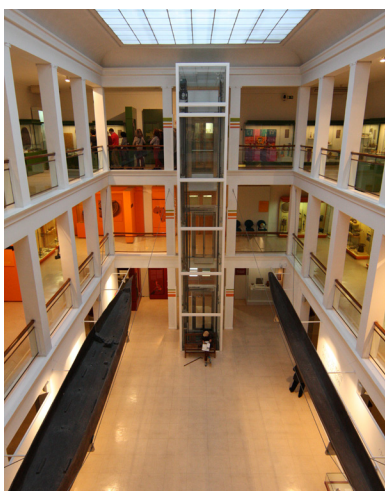
Figura 1. Panorámica de la exposición permanente del MNA. En la primera planta se encuentran las salas de Filipinas y religiones orientales, en la segunda la sala de África y en la tercera la de América.