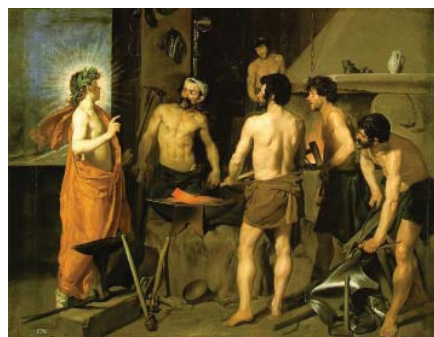
La fragua de Vulcano . 1631. Velázquez. Óleo sobre lienzo. 223x 290 cm.