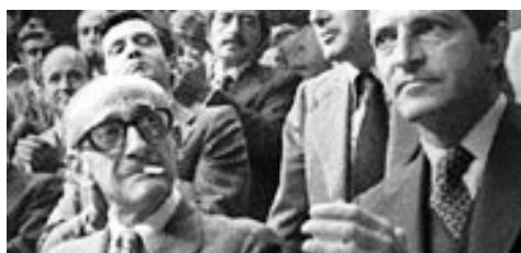
Arriba: Adolfo Suárez y Gutiérrez Mellado. Derecha: El golpe de estado del 23 de febrero de 1981.