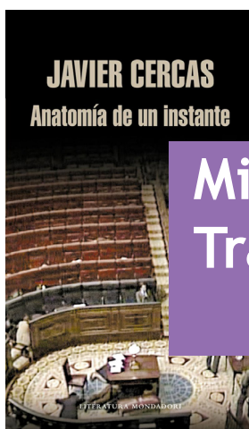
Cubierta de Anatomía de un instante.