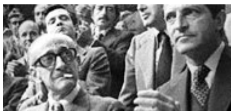
Arriba: Adolfo Suárez y Gutiérrez Mellado. Derecha: El golpe de estado del 23 de febrero de 1981.