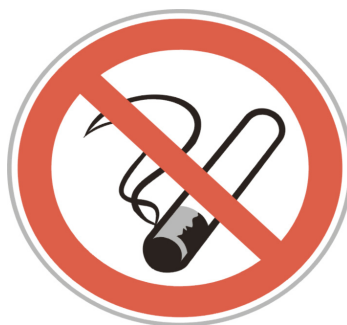
Cartel de prohibido fumar.

Esta reciente ley favorecerá la protección de los no fumadores, pero sus efectos no se verán hasta los próximos meses cuando se valore su alcance. "España, país sin humos para siempre" puede convertirse en una realidad en un futuro cercano.