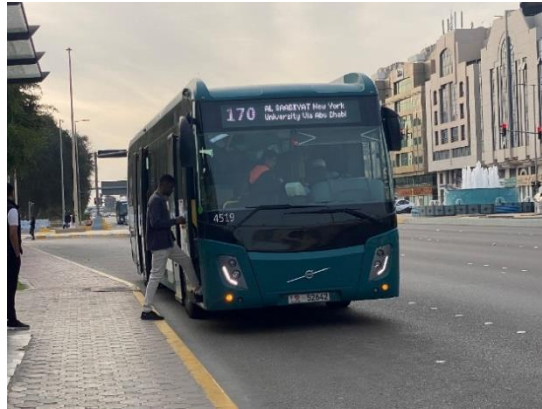
Autobús urbano en Abu Dabi

La red de bus interurbano también es extensa, uniendo todas las ciudades del país con la estación de autobuses cercana a la Embajada. Es también económico, costando lo equivalente a 7 EUR un trayecto hasta Dubái que, sin tráfico, puede durar 1,5 horas. Los vehículos, eso sí, suelen ir siempre llenos.