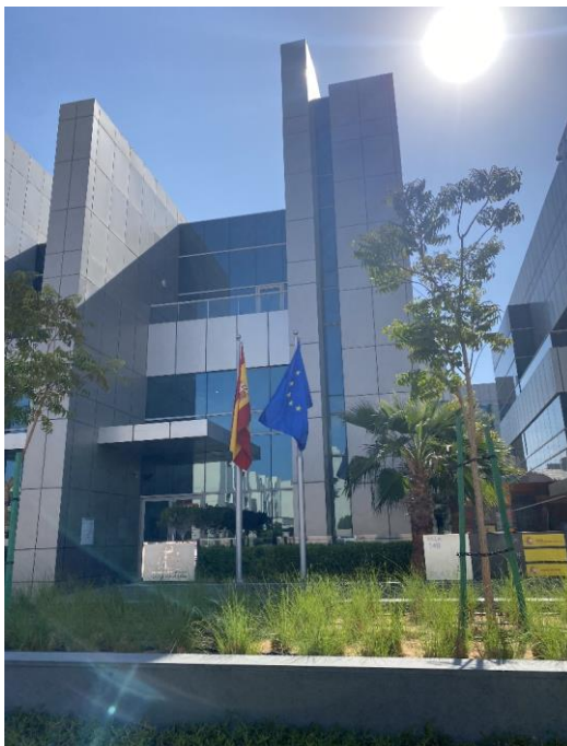
Edificio de la Embajada de España