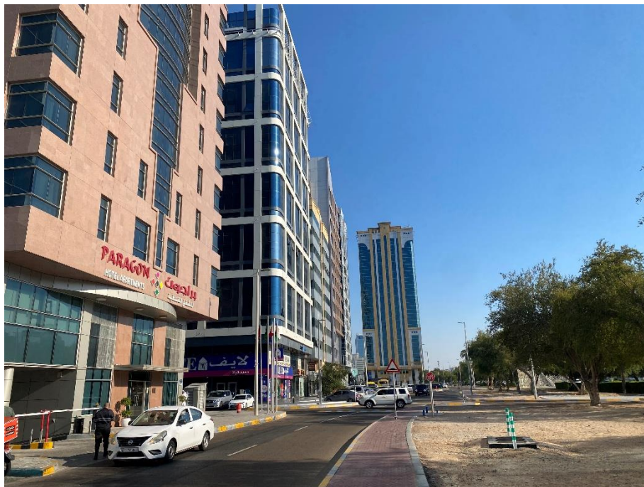
Edificios de apartamentos en el entorno de la Embajada

Como primer alojamiento en la zona de la Embajada algunas opciones pueden ser Al Diar Sawa Hotel Apartments , Executive Suites o Villagio Hotel Resort .