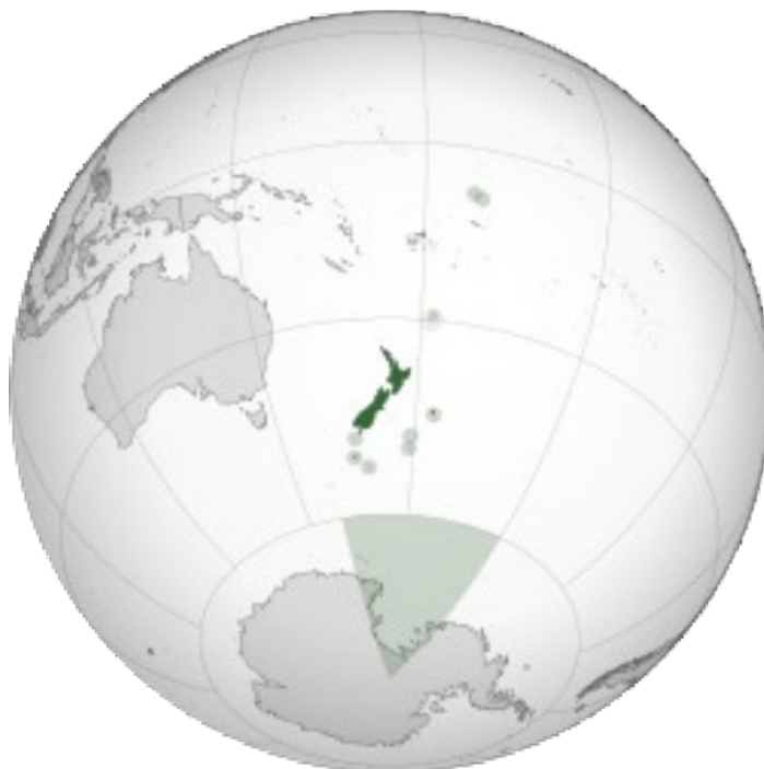
Mapa geográfico de Nueva Zelanda de Wikipedia