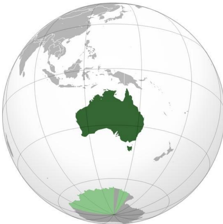
Mapa geográfico de Australia de Wikipedia