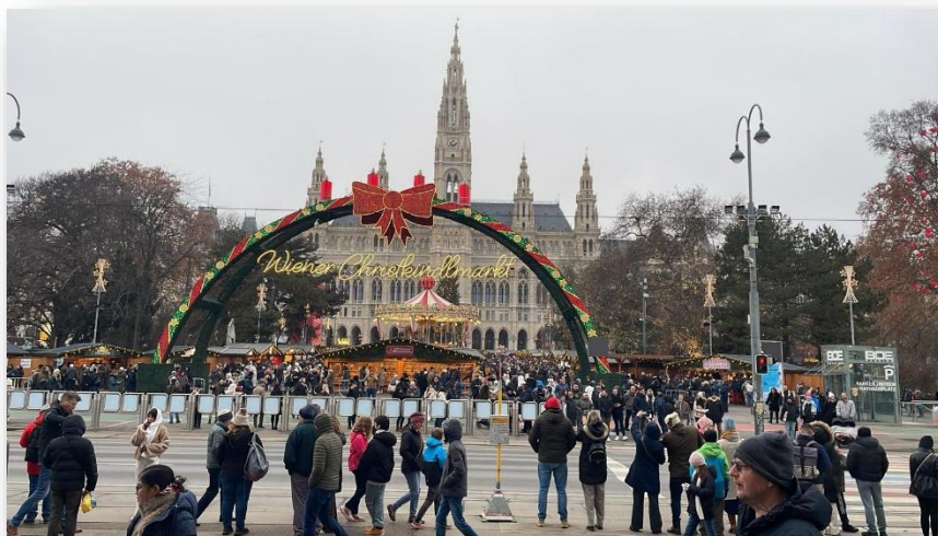
Mercados de Navidad

La población de origen extranjero la constituyen alrededor de 2.500.000 personas , principalmente ciudadanos procedentes de países próximos, entre ellos, Alemania, Rumanía, Turquía, Serbia, Hungría, Croacia, Bosnia y Herzegovina, y Ucrania. Actualmente hay cerca de 10.000 españoles residentes en Austria , de los cuales más de una tercera parte vive en Viena.