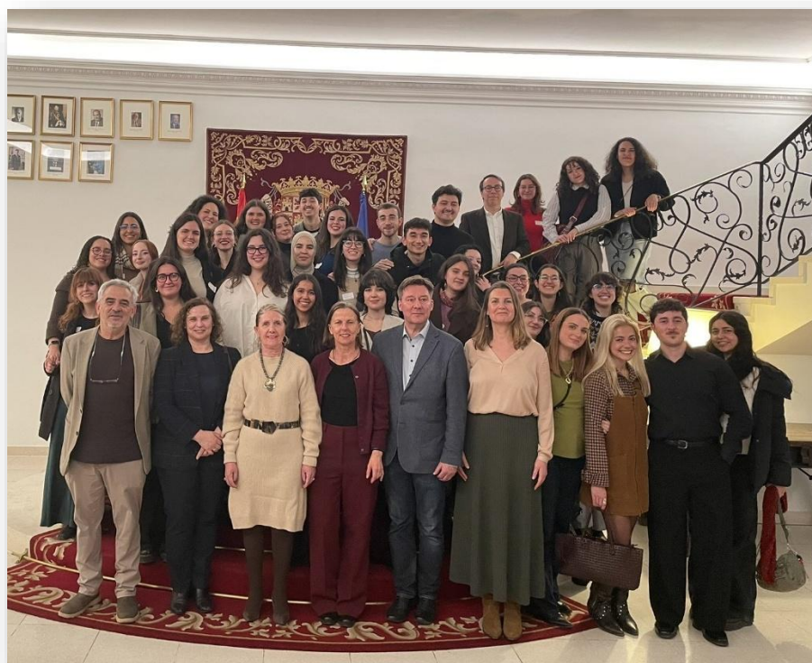
Recepción en la embajada. XI Jornadas de los Auxiliares de Conversación en Austria 2025-26