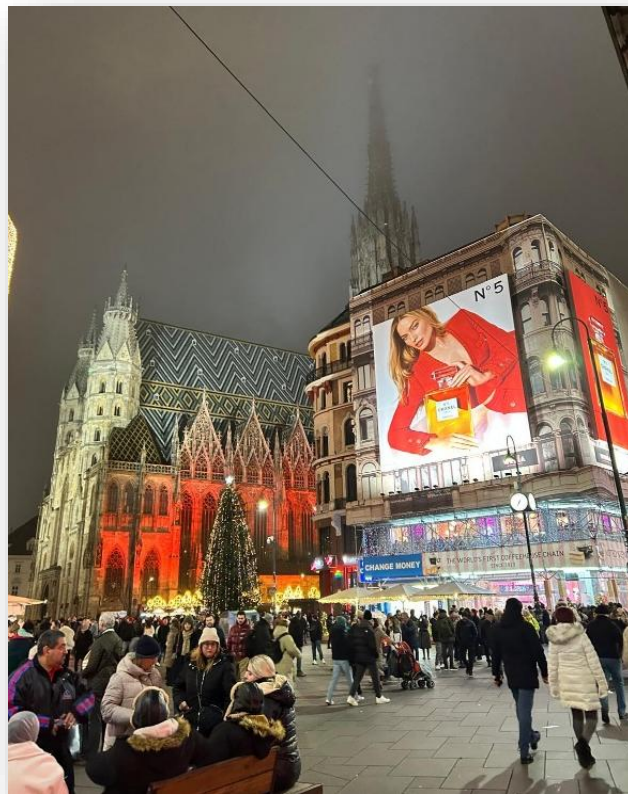
Catedral de St Stephan, Viena

Finalmente, el país ofrece muchas oportunidades de practicar deportes de invierno a un precio asequible o de realizar excursiones por los Alpes en el marco de unos paisajes realmente bellos.