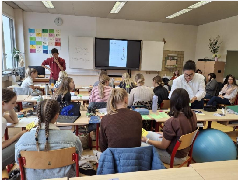
Sesión de formación Seminario Altenmarkt

El seminario de iniciación ofrece información y talleres de trabajo sobre los derechos y deberes como auxiliar de conversación, metodología y didáctica y planificación de clases, entre otros.