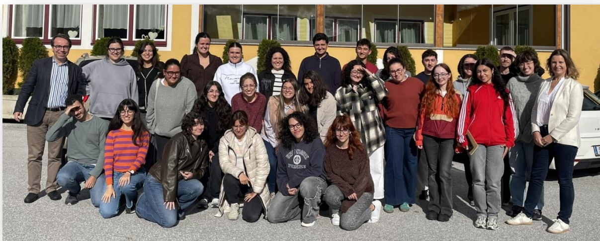
Grupo de auxiliares de conversación en Austria. Curso 2025-26

El proceso de selección de participantes se lleva a cabo a través de la mencionada convocatoria pública anual del Ministerio de Educación, Formación Profesional y Deportes, en colaboración con el Ministerio de Educación austríaco. Se puede consultar la última convocatoria en el apartado "direcciones y páginas web" de esta guía.