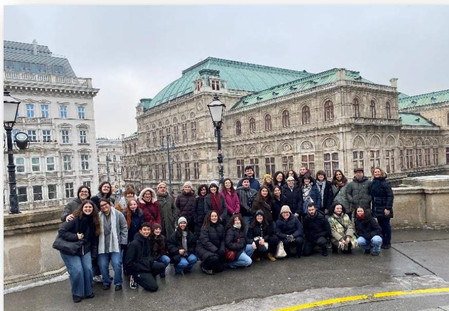
Visita al Museo Albertina (XI Jornadas de Formación). Enero 2026

Hay que solicitar al centro o profesor/a mentor/a una carta de recomendación al final de la estancia. También se puede solicitar a la(s) escuela(s) que expida(n) un certificado. Las respectivas plantillas en alemán e inglés se encuentran en la web de 'Welteitunterricht'.