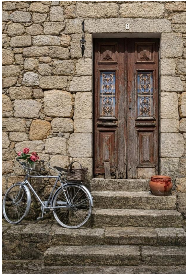
Entrada de casa típica en Aldeias históricas do Xisto

Los contratos de internet del hogar suelen llevar aparejado un período de permanencia de veinticuatro meses, con penalizaciones por cancelación anticipada. Para estancias de un solo curso académico puede ser más conveniente una tarifa de prepago o un contrato sin permanencia; serán algo más caros, pero evitan complicaciones al terminar. Los paquetes de internet y televisión oscilan entre treinta y sesenta euros mensuales; la telefonía móvil, con datos generosos, entre quince y treinta euros.