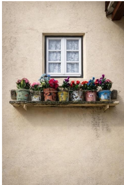
Ventana típica portuguesa en Belmonte

Para realizarlo, es necesario averiguar a qué demarcación consular pertenece el distrito de residencia y solicitar la inscripción por correo electrónico: