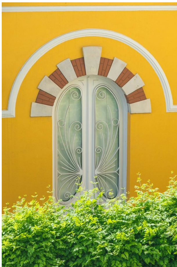
Ventana en la Freguesía de Estrela, Lisboa