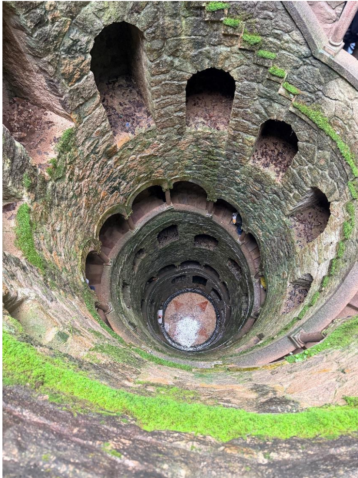
Pozo iniciático de la Quinta da Regaleira, Sintra

Además de su labor docente, el personal lector asume funciones culturales en colaboración con la Consejería de Educación: organiza actividades en su universidad orientadas a la difusión del español y la cultura españolas, y participa en iniciativas más amplias coordinadas desde la representación diplomática. Todo ello sin perjuicio de sus obligaciones académicas ordinarias. En cuanto a los centros de destino, las plazas corresponden a las universidades de Aveiro, Beira Interior, Coimbra, Évora, Lisboa, Minho, Trás-os-Montes e Alto Douro y Oporto. Los destinos pueden variar de una convocatoria a otra en función de las necesidades de cada institución y de los convenios vigentes con la Consejería.