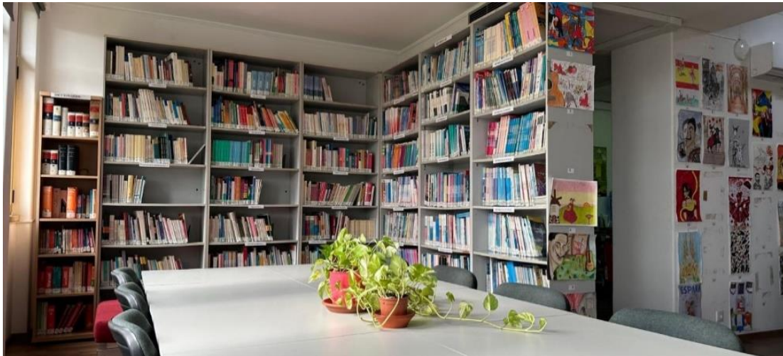
Área de reuniones del Centro de Recursos

Ubicado en la Avenida Liberdade de Lisboa, el Centro de Recursos es un espacio abierto que cumple con una misión doble: apoyar la enseñanza del español como lengua extranjera y atender a cualquier persona que necesite información o gestiones relacionadas con la educación no universitaria en Portugal o en España.