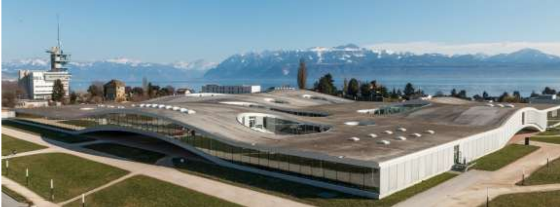
El Rolex Learning Center, en Lausana

Por lo que se refiere a las instituciones universitarias propiamente dichas, estas en Suiza se tipifican del modo siguiente: