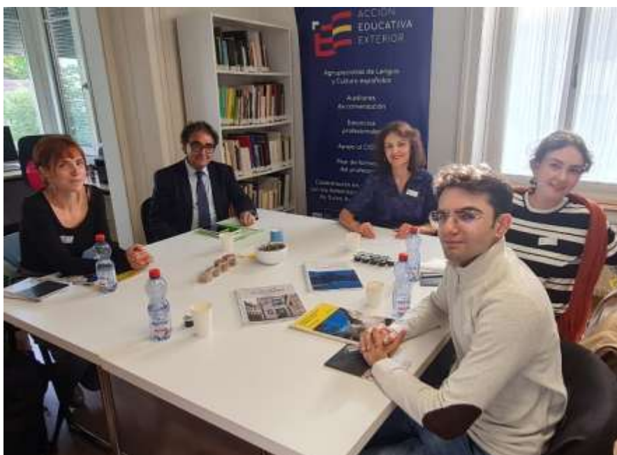
Los auxiliares de conversación visitan la consejería de Educación en Berna (curso 2025-26)

Es conveniente pedir el currículo de español de los diferentes grupos, los libros de texto y las programaciones de clase. Esto ayudará a entender el trabajo que se realiza y programar las sesiones, siempre en colaboración con el profesorado. Conviene conocer, asimismo, los programas de estudio que preparan los exámenes de madurez equivalentes a nuestra selectividad.