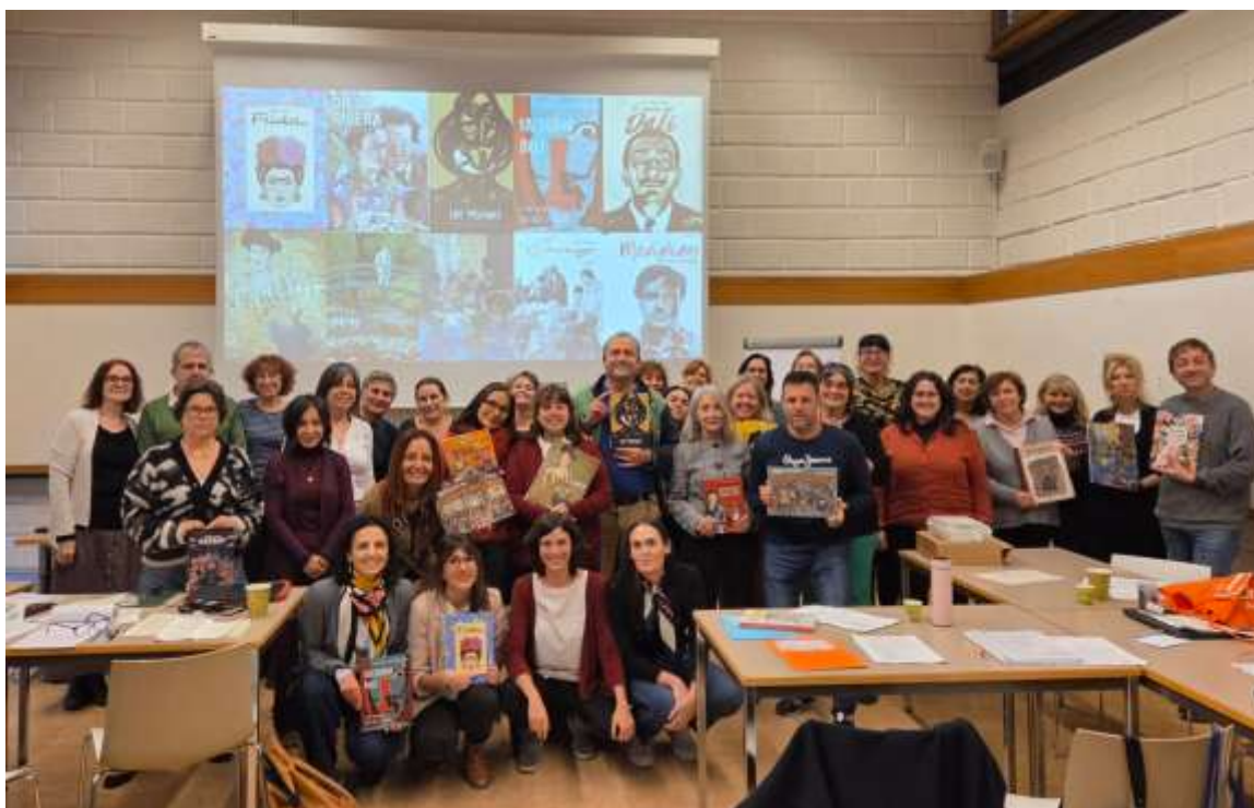
Curso de actualización docente sobre "Arte y ELE" en Ginebra. Noviembre de 2025.

La Consejería de Educación en Suiza desarrolla anualmente un plan de formación de actualización científica y didáctica dirigido al profesorado suizo y español. Los auxiliares pueden participar gratuitamente en estos cursos de formación y tener la posibilidad de intercambiar experiencias y conocer a otros docentes suizos y españoles del programa de las Agrupaciones de Lengua y Cultura Españolas (ALCE). Se aconseja vivamente esta participación, para lo cual les animamos a que se pongan en contacto con la dirección de la agrupación ALCE operativa en el cantón donde está residiendo o tiene su centro educativo.