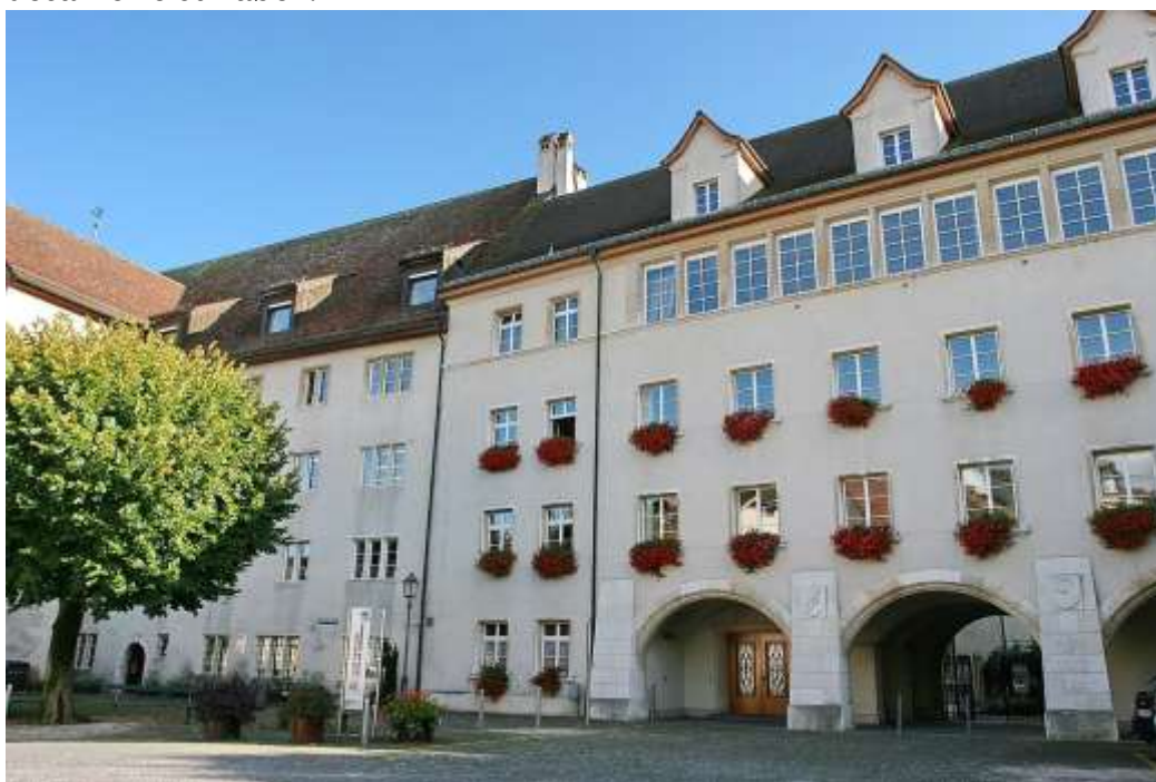
Lycée Cantonal de Porrentruy

Es especialmente apreciada su función en tareas de enseñanza y práctica de la expresión oral e, incluso, actividades extraescolares como organización de excursiones o visitas a centros culturales españoles. En Suiza, ser auxiliar de conversación puede suponer llevar la responsabilidad de un curso. La situación puede variar en gran medida en función del centro y del cantón en el que desarrolle su labor.